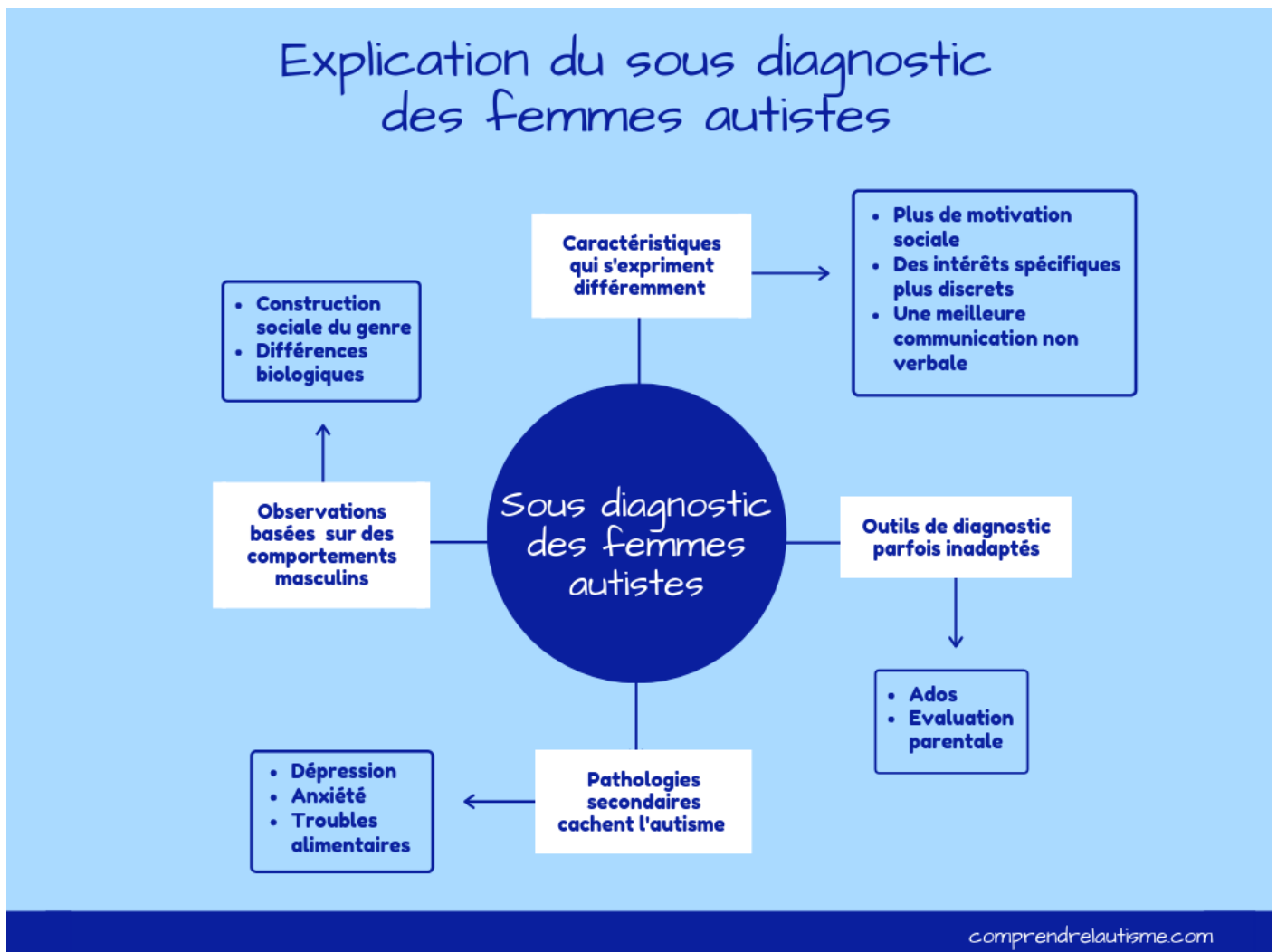
Schéma explicatif du sous diagnostic des femmes autistes

La dyade autistique qui permet de poser le diagnostic d'autisme est bien présente mais elle s'exprime différemment chez certains profils féminins. Elle prend une forme et des caractéristiques qui ne sont pas celles rencontrées habituellement par les psychiatres et cela contribue au sous diagnostic des femmes autistes.